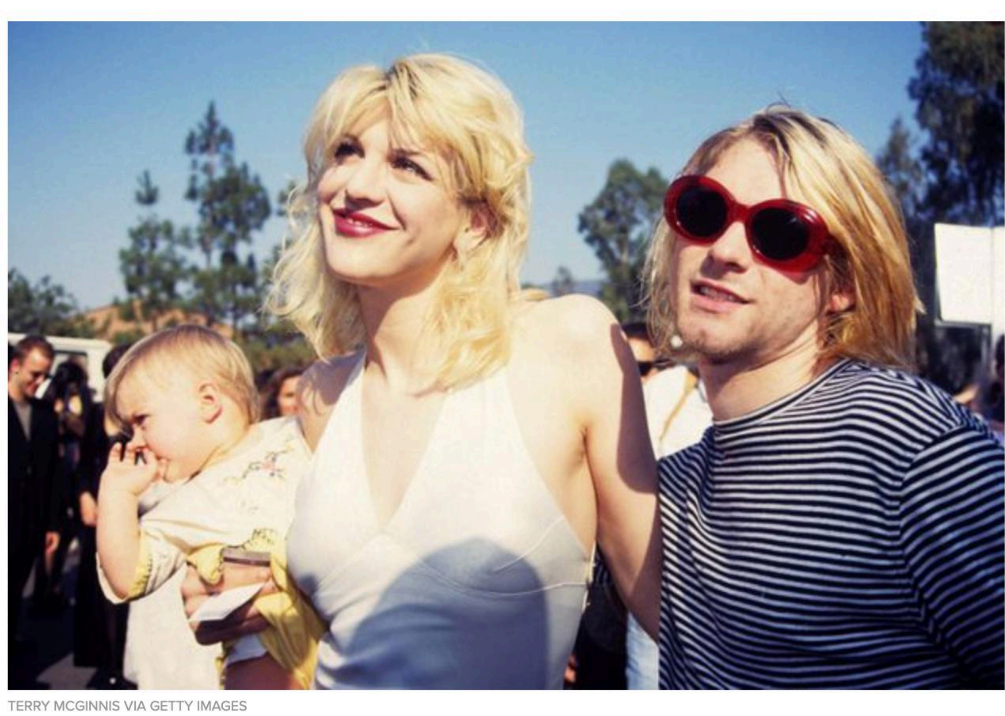
Kurt Cobain, à droite, avec son épouse Courtney Love, en 1993.