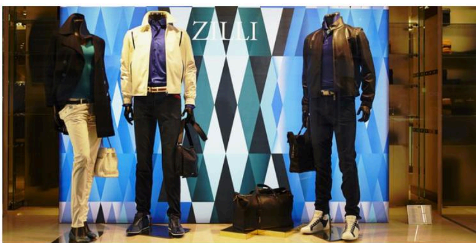
Boutique Zilli, rue François 1er à Paris (2014)

Mis à jour le 06/12/2016 à 06H30, publié le 25/06/2015 à 09H40