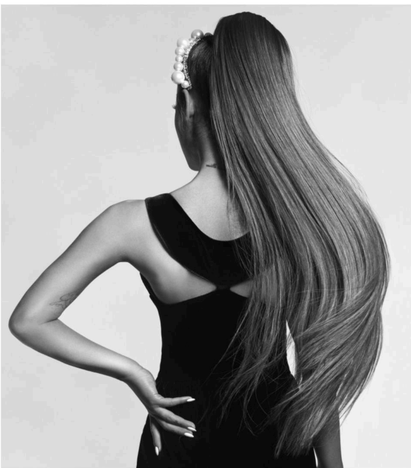
Craig McDean pour Givenchy

Les deux se ressemblent dans leur apparence dite "gamine" : par leur look de femme-enfant inclassable, elles jouent d'un trouble entre les âges, entre les générations. La différence ? Ariana porte les ongles et le cheveu XXL, et son corps est parsemé de tatouages. Autrement dit, elle joue autour des codes sexués et actuels, qui font d'elle une millennial pur jus.