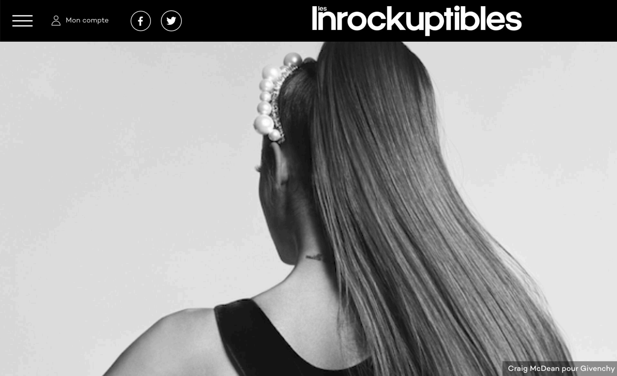
Craig McDean pour Givenchy